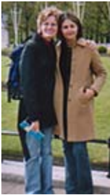
مع صديقتي الكندية هينر