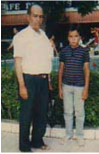
والدي الرائع، قلعتي